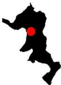
Zone où se déroule la randonnée

Cette randonnée est assez facile, le terrain ne pose guère de difficultés si ce n'est en période de pluie (dans ce cas évitez de vous rendre au fond des ravins). La seule difficulté notable sera l'ascension d'une colline tabulaire par une piste très pentue, l'effort à fournir n'est pas insurmontable et sera récompensé par un superbe panorama. Au milieu de la randonnée, entre la colline tabulaire et l'entrée dans le Barranco de las Cortinas, les sols se révéleront par moment assez chaotiques avec des sentiers très mal définis, nous devons nous orienter au jugé sans que cela ne pose un réel problème. Ultime recommandation, il faudra se montrer prudent en haut des ravins (« gouffres » et sols friables en bordure du précipice) ainsi que dans les badlands.