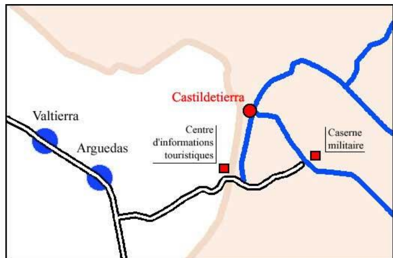
Point de départ (rond rouge)